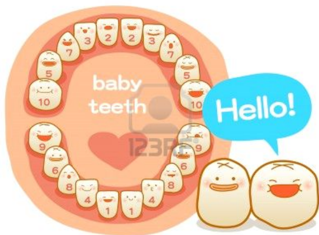
Hammaste lõikumine suhu